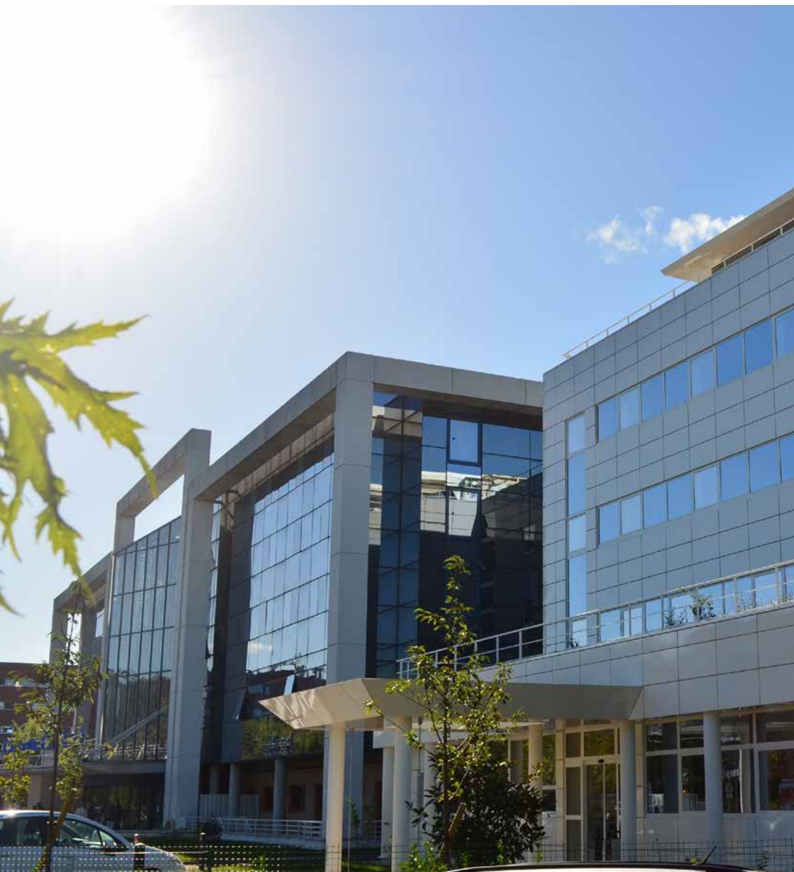
Clinique Claude Bernard, Ermont