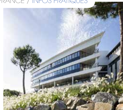
De gauche à droite : CHU d'Amiens – Centre Antoine Lacassagne, Centre de lutte contre le cancer de Nice – Institut de Cancérologie de l'Ouest, Nantes